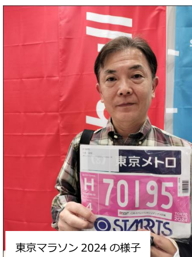
東京マラソン 2024 の様子