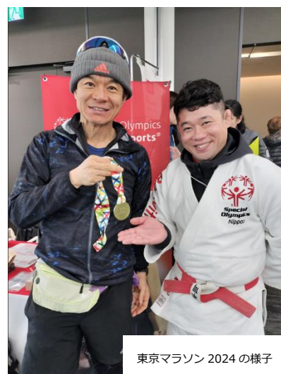
東京マラソン 2024 の様子