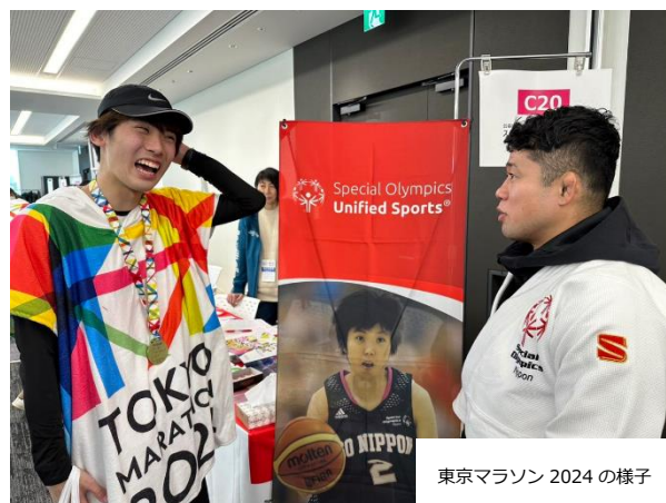
東京マラソン 2024 の様子