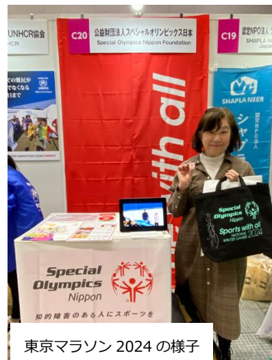
東京マラソン 2024 の様子