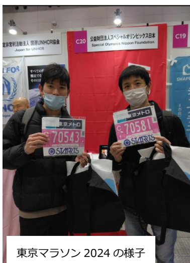
東京マラソン 2024 の様子