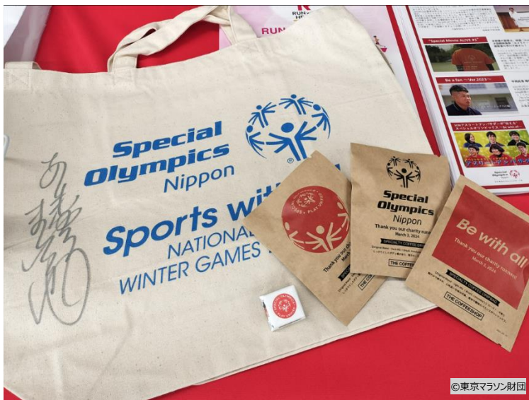
↑ トートバッグ、ドリップコーヒー、オリジナルチョコ