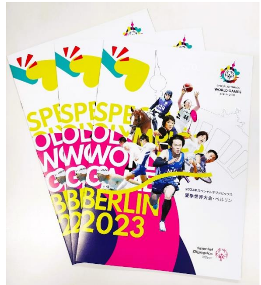
↑ 世界大会の活動報告書冊子

(公財) スペシャルオリンピックス日本は、東京マラソン財団チャリティ RUN with HEART の寄付先団体です。 東京マラソン財団チャリティ RUN with HEART 公式ウェブサイト: https://www.runwithheart.jp/