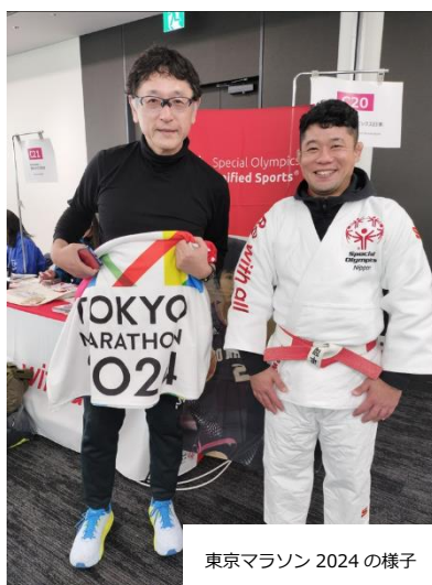
東京マラソン 2024 の様子