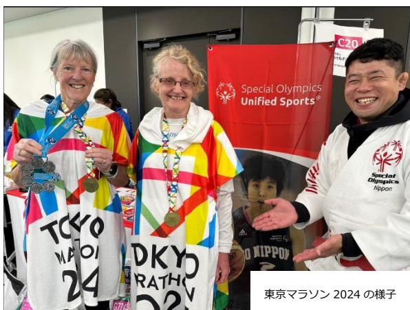
東京マラソン 2024 の様子