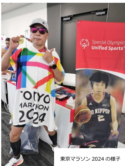
東京マラソン 2024 の様子