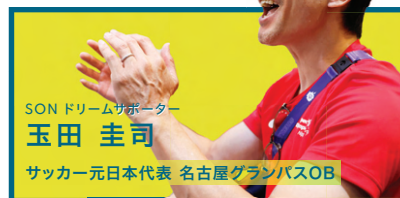
SON ドリームサポーター 玉田 圭司 サッカー元日本代表 名古屋グランパスOB