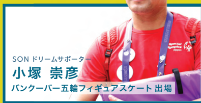
SON ドリームサポーター 小塚 崇彦 バンクーバー五輪フィギュアスケート 出場