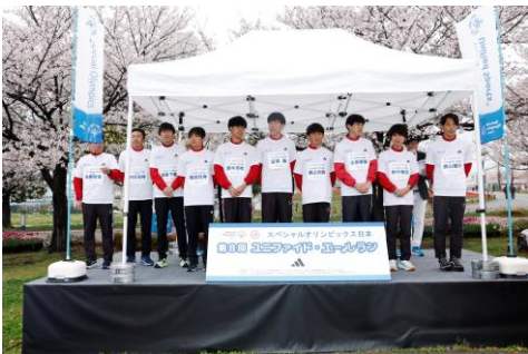
トヨタ自動車陸上長距離部の皆様