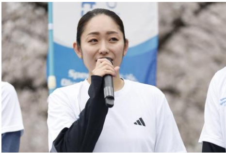
スペシャルオリンピックス日本 ドリームサポーター 安藤美姫さん