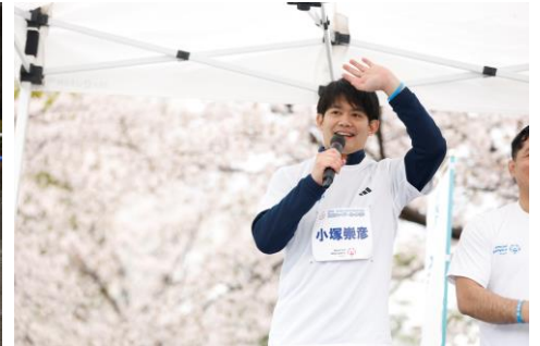
スペシャルオリンピックス日本 ドリームサポーター 小塚崇彦さん