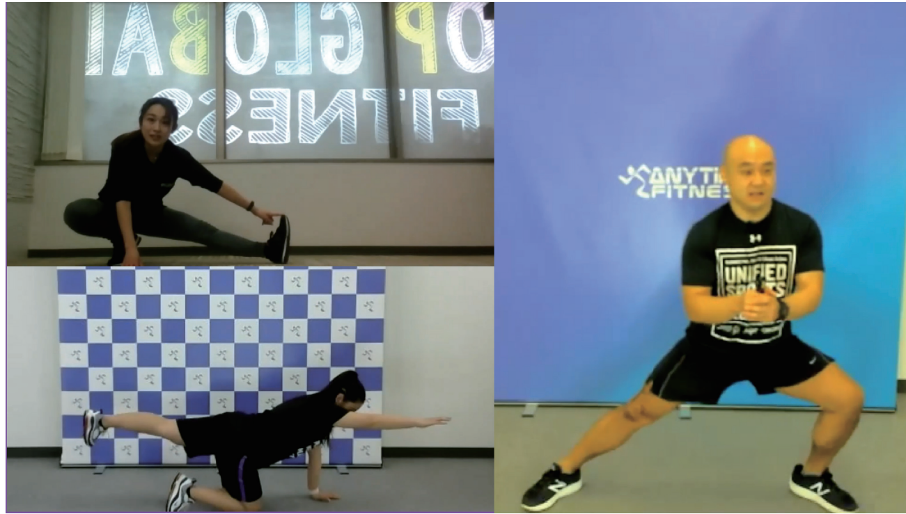
【ユニファイドトレーニングの様子】